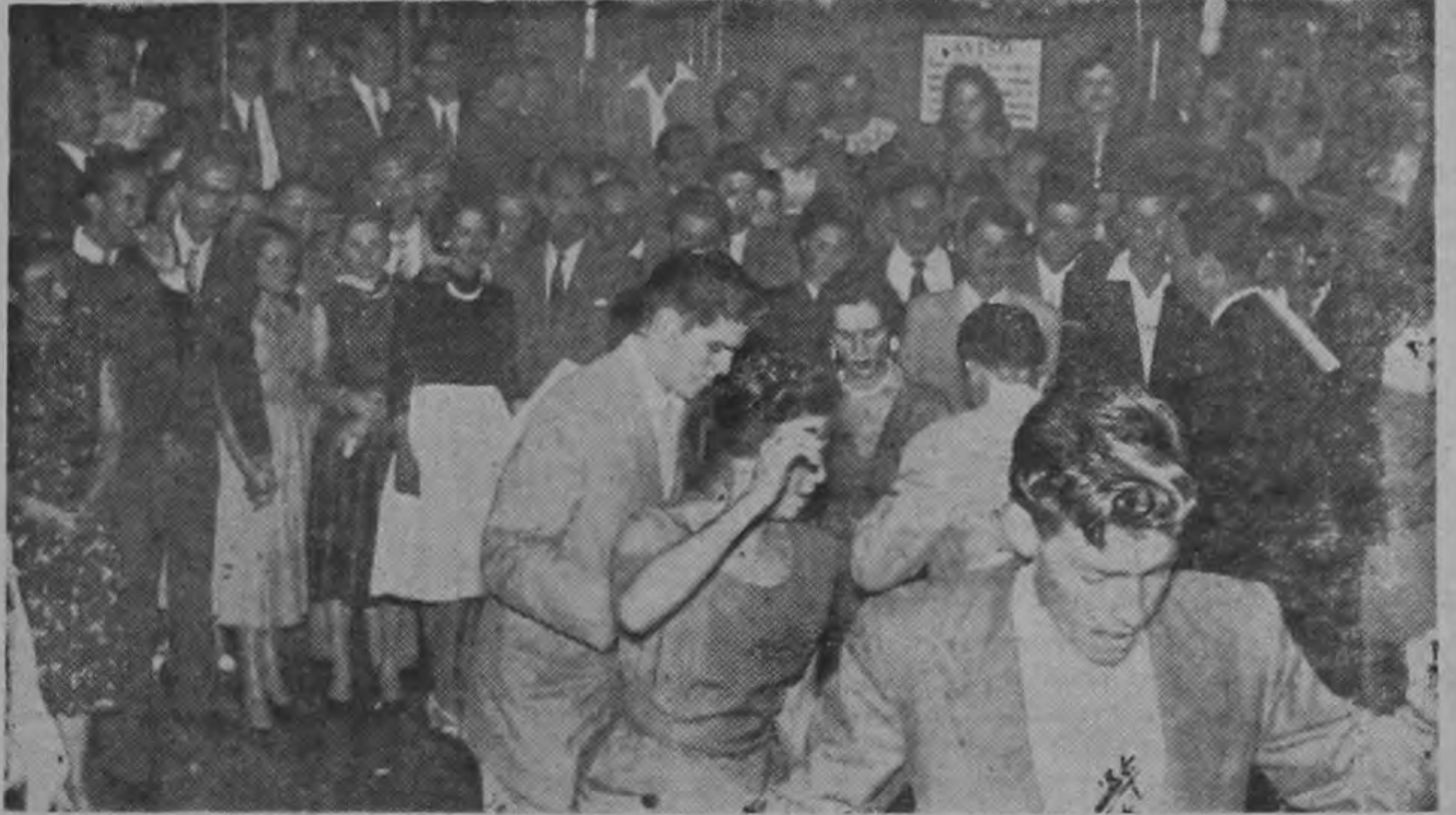
Competencia de cha cha cha, con un premio de cien colones a la pareja ganadora. Aquí los vemos en plena actividad, tanto por alcanzar el premio, como por dar una buena demostración de sus habilidades.—

Una aportación más de la gran familia eléctrica para ayudar a levantar el Hospital para los Niños.— Ese día fue celebrado el segundo aniversario de la reapertura del Club para Empleados de la Compañía Nacional de Fuerza y Luz