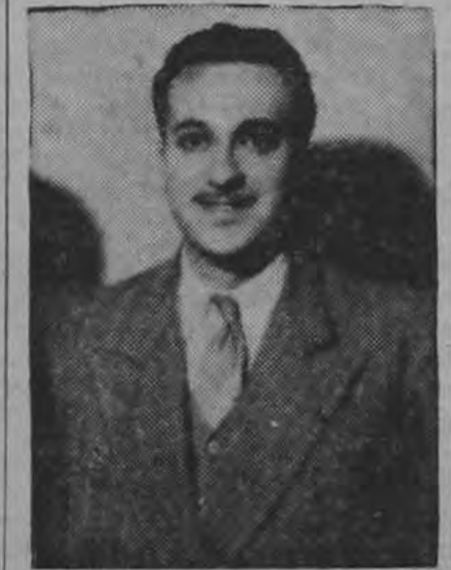
Embajador ALBERTO CAÑAS... misión cumplida...