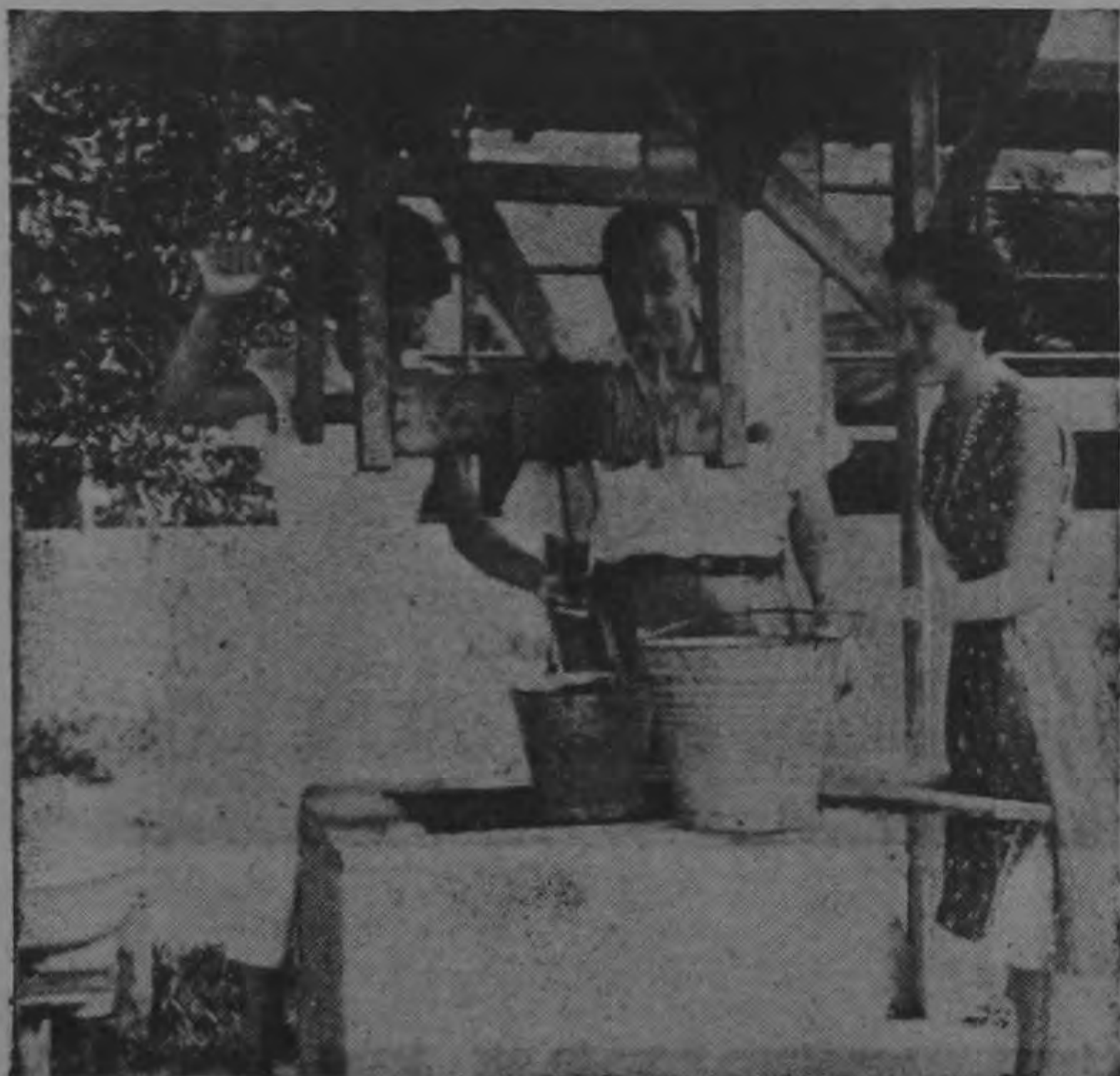
Todavía hay mucho qué hacer en cuanto a acueductos, cañería, comodidad humana, alimentación, salud pública, educación, etc.; pero ORLICH LO HARA. El próximo gobierno liberacionista será una nueva social de Costa Rica. ¡Usted lo sabe!

En cuatro años no es posible hacer todas las cosas que se dejaron de hacer en cuatro siglos.