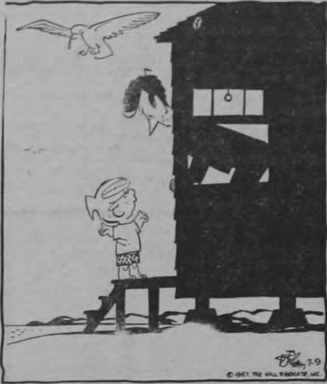
Vamos, que no es tan temprano... Las gaviotas están levantadas ya...