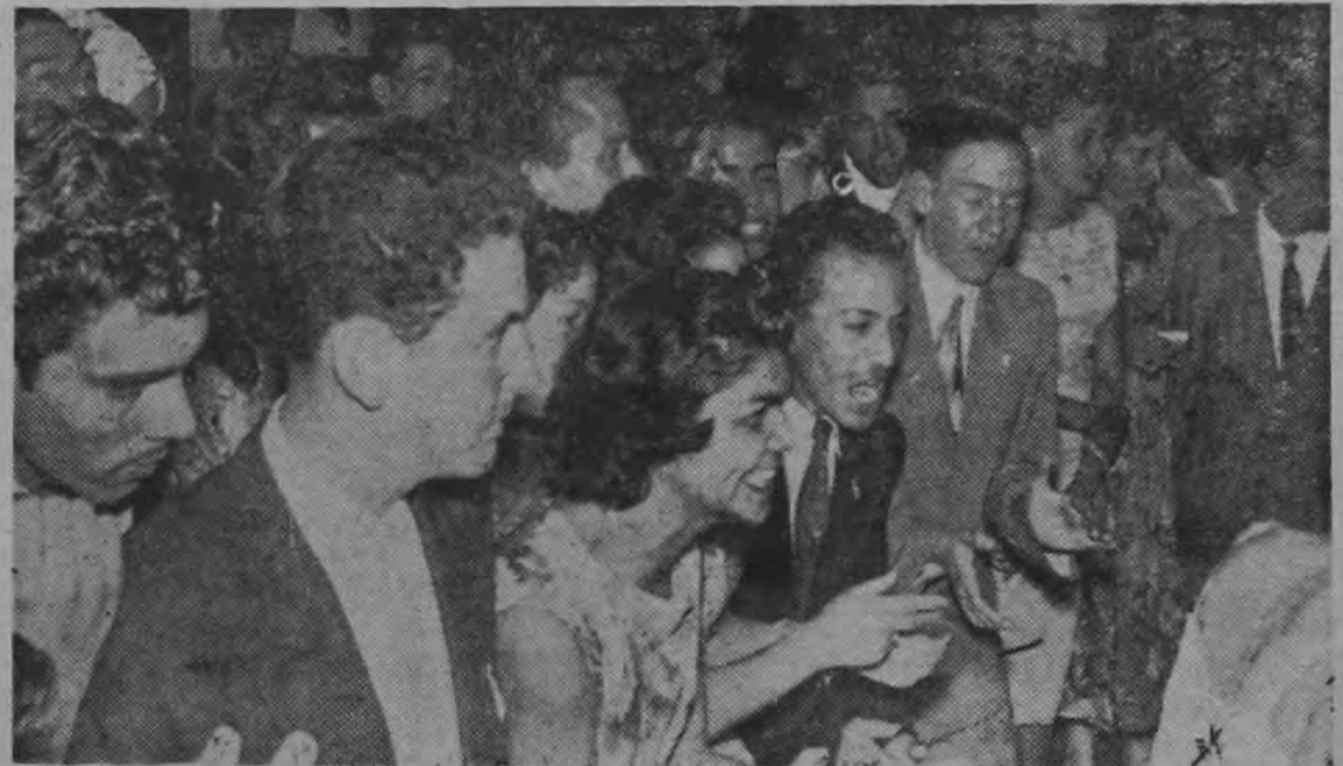
Los no concursantes, entusiasmados con aquel "movimiento", aplauden y gritan dando opinión sobre qué pareja debe merecer el premio. La foto da una ligera idea de lo nutrido de la concurrencia.—

La Compañía Nacional de Fuerza y Luz S. A., y sus empleados en general, han acogido con singular entusiasmo la campaña que se ha hecho a fin de levantar en el país un buen hospital para los niños. La Empresa Eléctrica, por una parte, y los empleados indistintamente, han abierto su mano para dar su contribución, y no han negado toda cooperación a una cruzada tan noble y generosa, que traerá incalculables beneficios a la comunidad costarricense.