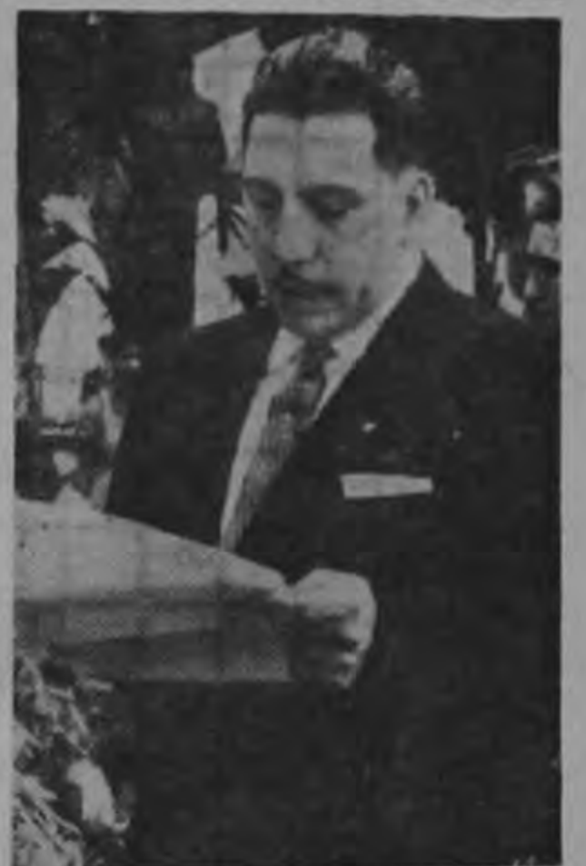
Embajador Renato Delcore

El Embajador de Costa Rica en Guatemala fue escogido por el Cuerpo Diplomático acreditado en ese país para que pronunciara el discurso el 12 de octubre en el homenaje a la reina de España Isabel la Católica. Correspondió al Embajador Renato Delcore contestar a las palabras del Embajador de España, con un interesante discurso. Al acto que se celebra anualmente en la plaza que lleva el nombre de la reina española, en la ciudad de Guatemala, asistieron el Ministro de Relaciones Exteriores, Lic. Jorge Skinner Klée, el de Educación Pública, periodista Baltasar Morales y miembros del cuerpo diplomático acreditado en Guatemala. La actuación del Embajador Delcore fue muy bien comentada en los círculos oficiales y diplomáticos de Guatemala.