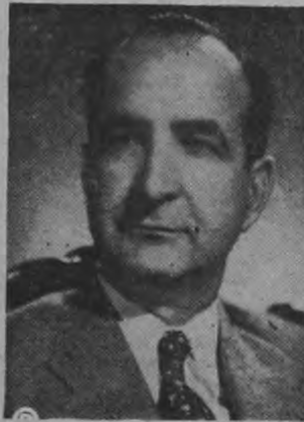
Presidente JOSE FIGUERES... iniciativa...

HOY PEDIRA ENTREVISTA AL TRIBUNAL ELECTORAL EL MINISTRO DE RELACIONES EXTERIORES