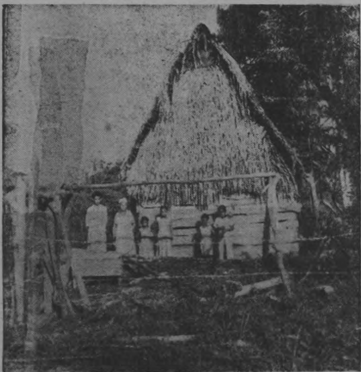
Todavía hay mucho qué hacer en cuanto a vivienda. Miles de familias no tienen todavía una casa decente. Liberación creó el Instituto Nacional de Vivienda para sustituirlo por casas decorosas. Más de tres mil familias han sido favorecidas en menos de tres años del plan de vivienda de Liberación Nacional.