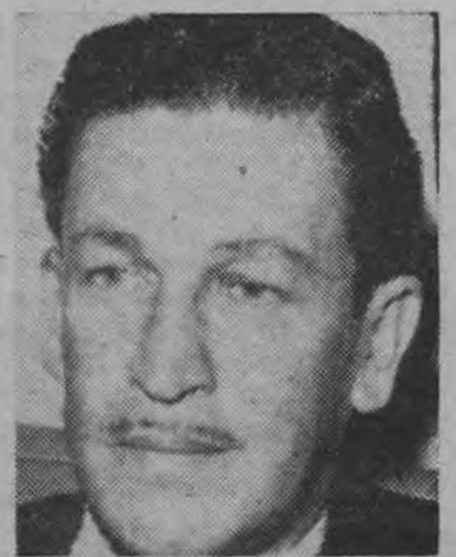
Canciller GOMEZ CALVO... con el Tribunal electoral...

La Comisión vendrá desde el mes de enero para que su presencia en el país no llene sólo un aspecto formal en el día de las elecciones, sino que tenga oportunidad de conocer a fondo los mecanismos electorales del país y la actuación de los partidos (TEXTO EN PAGINA 24)